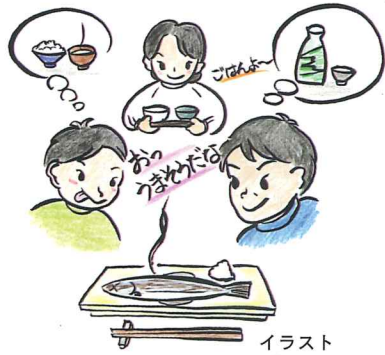
イラスト 井口三男

一般を指し、サカナは酒の添え物の意です。本来魚はウオと呼ばれサカナとは別のものでした。