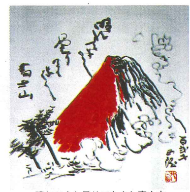
墨：天空に翔ける龍のごとし